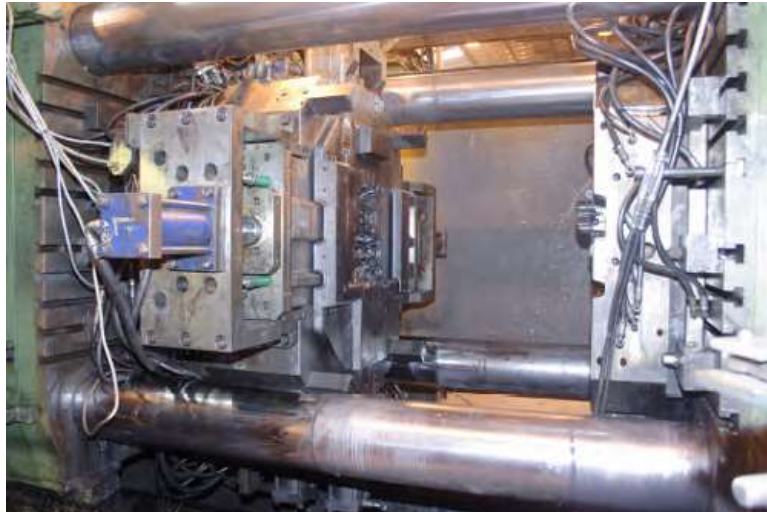
Hình 17.1: Một trong những khung đúc được bảo vệ bởi AquaKlear

Một vấn đề mà họ phải đối mặt nữa là tháp giải nhiệt của họ. Không chỉ cặn vôi tích tụ trong đó mà còn có vi khuẩn legionella. Tháp giải nhiệt phải ngưng hoạt động hai lần một năm để loại bỏ cặn ra khỏi đáy chữ “V” và túi lọc. Quá trình làm sạch thường sẽ mất 2 giờ.