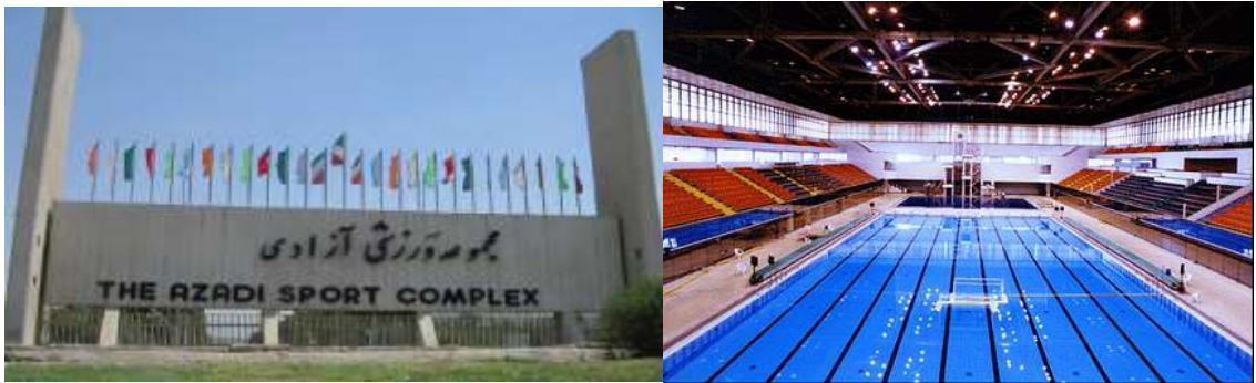
Hình 14.1: Khu phức hợp thể thao Azadi và hồ bơi Olympic

Khu phức hợp thể thao là có kích thước rộng 450 ha với các loại hình thể thao khác nhau