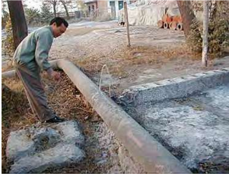
Hình 4.1: Một công nhân đo độ dày của lớp cáu trong đường ống bằng cách dùng một cây que đâm xuyên qua 1 cái lỗ trong đường ống. Phương pháp này chỉ dùng khi cáu đóng rất dày

Nhà máy làm ra khí gas ( C_2H_2 ) để cắt thép. Một trong những sản phẩm phụ từ quá trình sản xuất là đóng cáu canxi. Đường ống dài 2 km để vận chuyển sản phẩm phụ bị cáu làm nghẹt. Việc đóng cáu này ảnh hưởng rất xấu đến đường ống và đường ống đã được thay thế hàng năm.