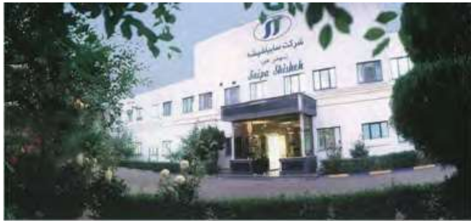
Hình 9.1: Nhà máy của công ty Saipa Shishe

Mỗi một tháng rửa đến hai tháng phải ngưng hai ngày để vệ sinh cấu trúc điện trở đun. Sau tháo dỡ các bộ phận của cuộn dây làm mát được làm sạch bằng axit. Axit này sẽ ăn mòn các cuộn dây, do đó các cuộn dây đã bị bào mòn hoàn toàn sau 4 đến 5 lần rửa axit.