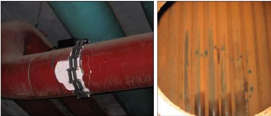
Hình 14.2 Loại tùy chỉnh 14" (trái) để bảo vệ các nồi hơi trong phòng máy trung tâm của Azadi

Chúng tôi đã cài đặt một thiết bị HydroFlow loại tùy chỉnh 14" trên đường ống hồi về từ một số máy của khu phức hợp.