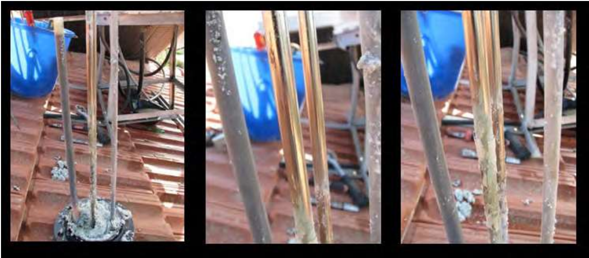
Hình 3.30: Các bộ gia nhiệt của các bộ đun nước nhúng chìm tại Son of the South village. Các mảng cấu bông ra từ bộ gia nhiệt

Son of the South là một ngôi làng ở Israel. Nước giếng được bơm lên một bể chứa để cung cấp nước cho cả làng. Độ cứng của nước là 300ppm. Trong tháng 8/2009 một HydroFLOW loại tùy chỉnh 8 inch được lắp đặt trên đường nước ra từ bể để xử lý cặn vôi.