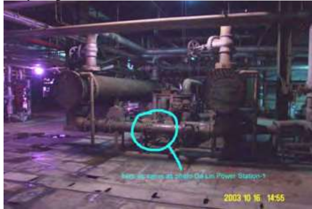
Hình 7.1: Một thiết bị AquaKlear tùy chỉnh 10 inch bảo vệ cho bộ trao đổi nhiệt (Heat Exchangers)

Nước biển được sử dụng như một chất làm mát trong bộ trao đổi nhiệt (Heat Exchangers), hình 7.1. Từ lúc nhiệt độ bên trong bộ trao đổi nhiệt dưới 50 độ thì cáu không là vấn đề lớn. Vấn đề là xác rêu ( Biofouling). Nguyên cứu cho thấy một lớp rêu thạch ( Microfouling) dày 250 micron ( 1/4 mm), bị nhiễm bẩn do vi sinh vật hơn là do trài sò. Có thể làm giảm hiệu quả truyền nhiệt tới 25%