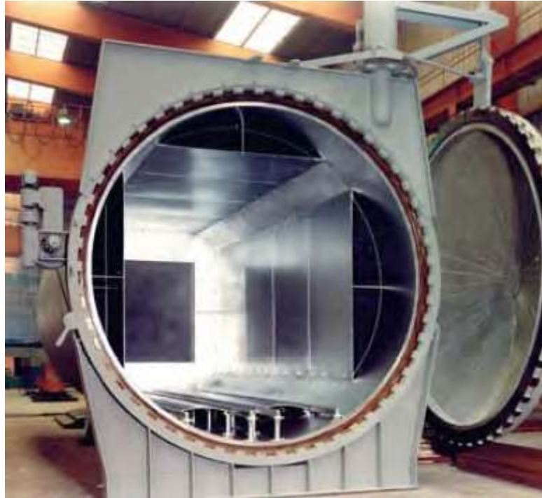
Hình 9.2: Nồi hấp 8 x 3 m của nhà máy Saipa Shishe

16 tháng sau đó, khách hàng đã rất hài lòng về hiệu quả của thiết bị Hydropath và đã gửi một bức thư chứng minh sự hài lòng của mình về: