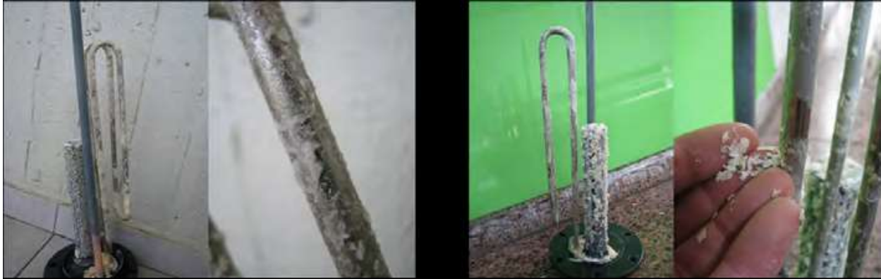
Hình 3.34: Những bộ gia nhiệt của máy nước nóng kiểu nhúng tại ký túc xá Đại học Tel Aviv university. Cáu không dính chặt vào thiết bị và dễ dàng bong ra

Vào ngày 25 tháng 5 năm 2010 Pazgas lắp đặt 2 thiết bị HydroFLOW C120 cho hai đường nước đầu vào để chống cáu cho đường ống và giảm ăn mòn cho nồi hơi.