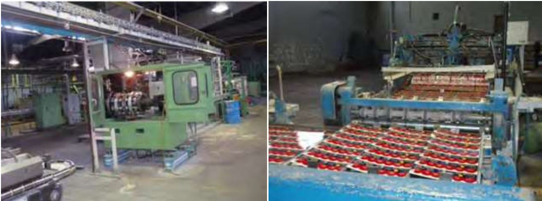
Hình 8.1: Các nhà máy của công ty bao bì Mashad

Công ty bao bì Mashad là công ty chuyên sản xuất hộp kim loại cho thực phẩm và đồ uống đóng lon. Lon này được lắp ráp bằng cách hàn điện trở, đòi hỏi được kiểm soát tỉ mỉ về hệ thống thủy lực áp suất cao. Nếu thời gian hàn không chính xác, thì cả qui trình sẽ thất bại. Vì vậy các van điều khiển cho các hệ thống thủy lực cần phải ở trong tình trạng hoàn hảo, và thậm chí chỉ cần một lượng nhỏ cấu thổi cũng có thể ảnh hưởng lớn.