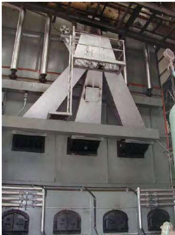
Hình 3.3: Lò hơi 45 tấn, 450 PSI, cao 4 tầng của hãng Vickers Hoskins được sử dụng trong nhà máy.

Một HydroFLOW S120 và một C100 được lắp đặt trong tháng 9 năm 2003. Xả đáy tự động được thiết lập 25 phút xả một lần trong vòng 20 giây.