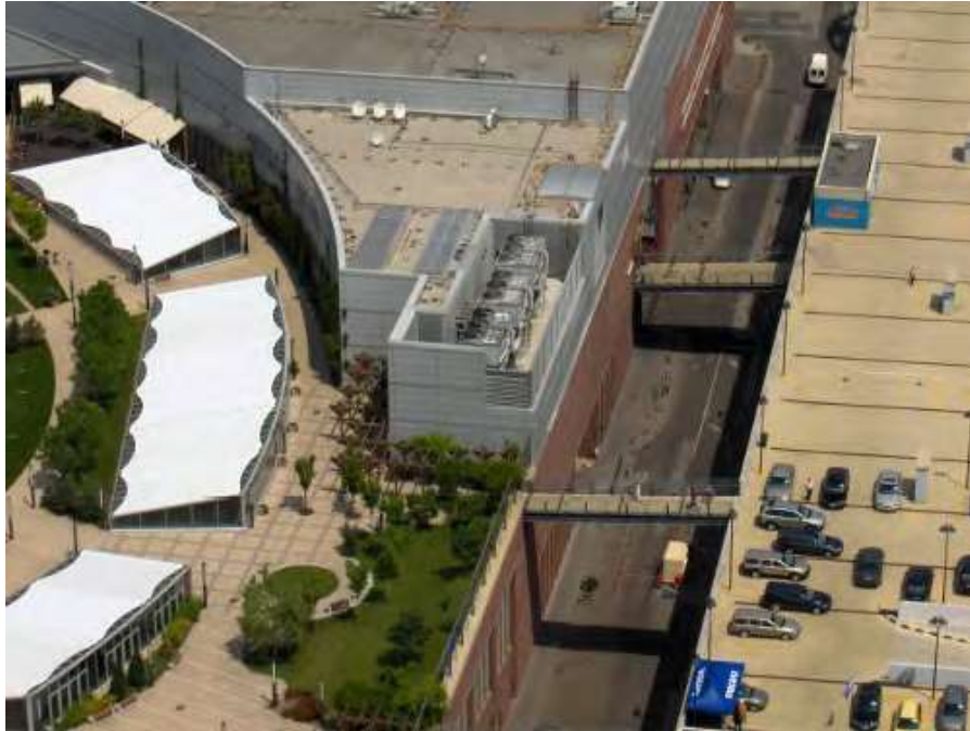
Hình 16.1: Một điểm nhìn toàn cảnh của trung tâm mua sắm West End ở Budapest, Hungary. Các tháp giải nhiệt được nhìn thấy tại trung tâm của hình ảnh.