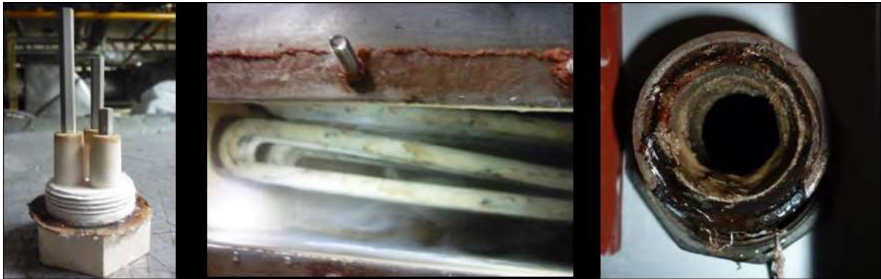
Hình 3.33: Bộ cảm biến ( sensor), thiết bị gia nhiệt và đường xả của máy hút ẩm không thấy cấu hình thành.

Thiết bị S38 được mua để bảo vệ bốn máy hút ẩm ( Dristemm VCL-25-1 model). Nước đầu vào được cung cấp từ một bể chứa có độ cứng là 91.91 ppm. Trước khi lắp đặt thiết bị thì máy hút ẩm này không được sử dụng bất kỳ cách xử lý nước nào. Trước khi các đường ống được tẩy rửa vào tháng 5 năm 2010 như là một phần của việc bảo trì thường xuyên , một loạt vấn đề nghiêm trọng về việc đóng cáu được phát hiện.