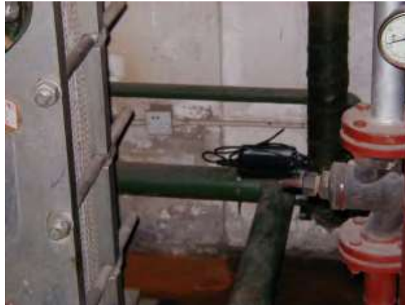
Hình 3.1: The C100 HydroFLOW được sử dụng cho máy trao đổi nhiệt ở cao ốc Shanxi Coal

Caos ốc Shanxi Coal là một tổ hợp gồm văn phòng và khách sạn. Họ sử dụng nhiều bộ trao đổi nhiệt ba tấm kết nối lại với nhau để cung cấp nước nóng cho khu phức hợp