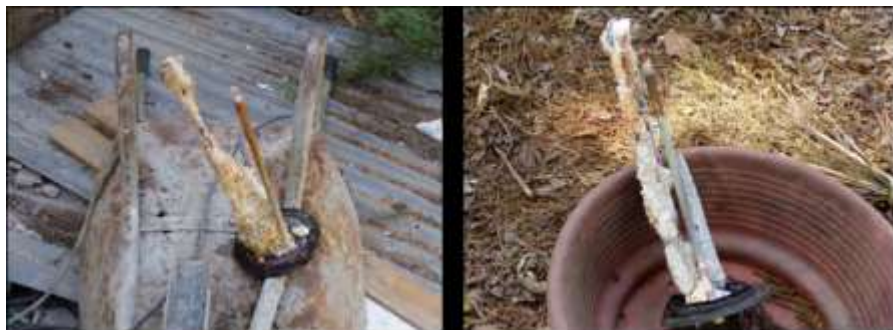
Figure 3.31: Một loại ống gia nhiệt điển hình không được bảo vệ ở Israel ( một địa điểm rất khó khăn về nước).

Các thiết bị trong làng này được bao phủ bởi một thứ gọi là “ bộ gia tốc” được áo ngoài thiết bị . Bộ này giúp gia tăng lưu lượng và trao đổi nhiệt, nhưng lại là điều kiện lý tưởng cho việc đóng cấu. Sự đóng cấu này được nhìn thấy rất rõ ràng.