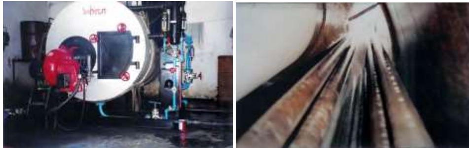
Hình 3.2: Lò hơi 20 năm tuổi được bảo vệ bởi thiết bị HydroFlow ( Trái ). Bên trong lò hơi không lưu lại cặn bẩn mà chỉ có một lớp bụi sáng ( Phải)

Nhà máy Cathay Murni cần một lượng lớn nước nóng để giặt hàng may mặc và lượng lớn hơi nước để ủi đồ. Chúng được cung cấp bởi một lò hơi ống lửa hoạt động đã 20 năm. Lò hơi này được giữ trong tình trạng tốt bằng cách thêm hoá chất làm mềm nước mỗi ngày và được tẩy rửa định kỳ mỗi năm. Độ cứng của nước cấp cho lò hơi là 200ppm