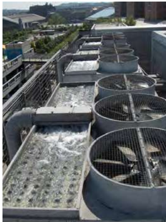
Hình 16.2: Các tháp giải nhiệt kiểu nước bay hơi (the evaporative water cooling tower) trong trung tâm mua sắm West End.

Thêm một lợi ích nữa mà trung tâm không dự đoán được là bây giờ họ không cần sử dụng nước thủy cục để cấp cho hệ thống giải nhiệt. Hệ thống giải nhiệt vẫn làm việc hiệu quả khi sử dụng nước ngầm.