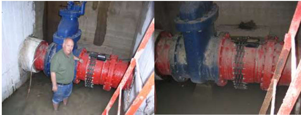
Hình 10.1: Các đường ống dẫn đến nhà máy điện đã được phủ một lớp cặn rất dày ( mới nhất). HydroFlow ngăn chặn cặn mới hình thành và bắt đầu loại bỏ cặn đang tồn tại. Một bức ảnh lắp đặt thiết bị vào năm 2002 ( trái). Lắp đặt thiết bị tương tự năm 2010 ( phải). Mức nước trong khu vực thường tăng cao hơn các đường ống do đó các thiết bị bị ngập nước hoàn toàn vì vậy bùn đất đã bám dính vào thiết bị!

Các đường ống dài 3 – 4 km, đi từ một hồ nước nhỏ đến sông Jordan. Đường ống của đường kính từ 16 inch đến 30 inch. Tại đoạn cuối đường ống dốc 60 m xuống nhà máy thủy điện phía dưới. Vấn đề là sự tích tụ của cặn vôi. Có một vòng cặn vôi dày 80mm rất cứng bám dọc đường ống. Năng lượng được tạo ra từ dòng chảy của nước thì lớp dày cặn vôi này là một vấn đề lớn.