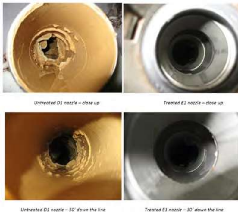
Hình 3.42: Bên trong đường ống không được điều trị ( phải) và được điều trị ( trái).

Nhà tắm E1 được điều trị bằng một thiết bị HydroFLOW tự điều chỉnh 8". Hình ảnh cho thấy sự khác biệt rất rõ ràng