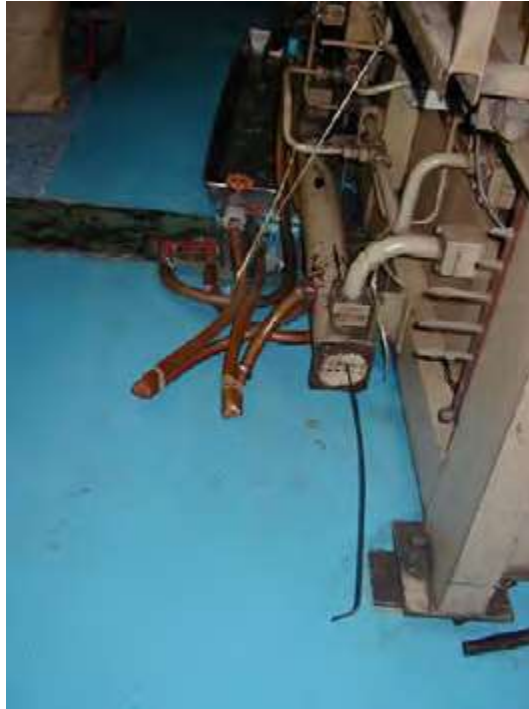
Hình 5.1: Các máy thổi nhựa được bảo vệ bởi HydroFlow. Việc loại bỏ cặn trong tháp giải nhiệt (cooling tower) được cải thiện nhằm làm mát máy thổi nhựa.

Salaya là một nhà máy nhựa. Có 10 máy thổi nhựa trong nhà máy. Độ cứng của nước trong khu vực là 380ppm và hoá chất xử lý nước được sử dụng để ngăn chặn việc hình thành cặn. Hai tuần 1 lần các tháp giải nhiệt và các bộ trao đổi nhiệt được vệ sinh, làm sạch. Một HydroFlow C60 được cài đặt vào tháng 6/2002